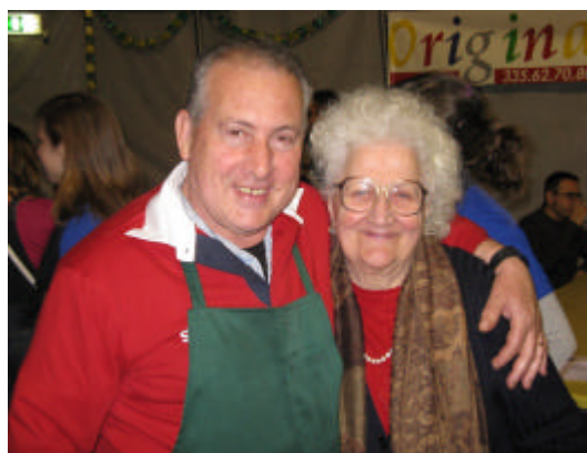
Un "cuciniere" del Comitato ed un ospite

quest" della Festa, il campione di rally Bobo Mainini, che ha fondato, sulla qualità sportiva della propria carriera, un'associazione che offre aiuto ai disabili motori.