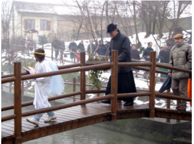
La Processione attraversa il Fontanile, per giungere alla Capanna