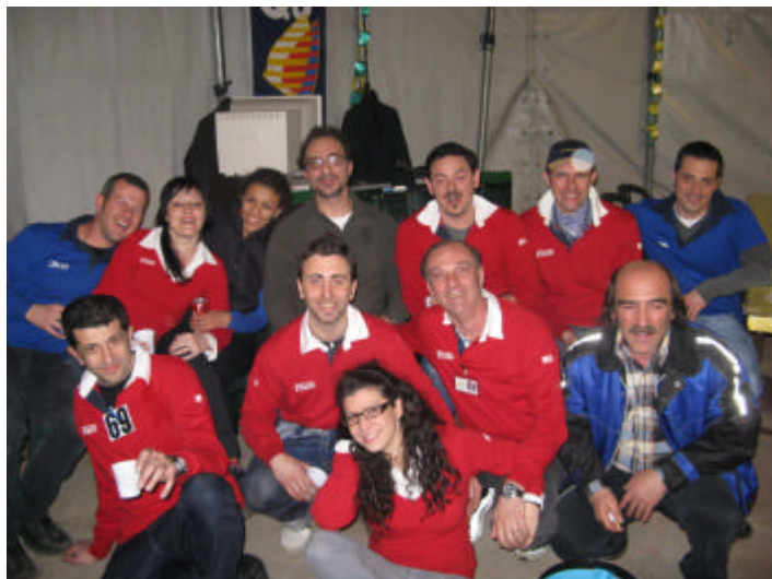
Una parte dei "lavoratori" della Festa, a notte fonda.

dei bonsai, graditissimo punto di attrazione del parco antistante il tendone. Sempre molto apprezzato, invece, l'animatore per i bambini che, sotto il tendone, al riparo dalla pioggia battente, ha fatto divertire i tanti bambini presenti. Unica annotazione negativa, per quanto mitigata dalla grande affluenza, è stata il comprensibile effetto della crisi generale in atto, che ha portato la gente, nonostante la partecipazione e lo