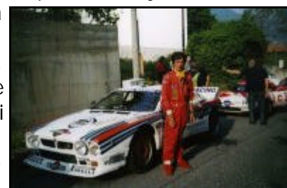
Bobo Mainini ed una sua auto

quest" della Festa, il campione di rally Bobo Mainini, che ha fondato, sulla qualità sportiva della propria carriera, un'associazione che offre aiuto ai disabili motori.